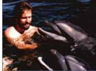
(1) Kommunizieren mit Delfinen

Der Delfin ist ein Meister der Kommunikation unter Wasser. Mit seinen Klicklauten und Pfiffen, die er überwiegend im Ultraschallbereich produziert, kann er sich ohne Probleme im Wasser orientieren und sich mit anderen Delfinen unterhalten – trotz hohen Seegangs oder starker Meeresströmungen. Ihr Sende- und Empfangssystem ist hoch sensibel und extrem anpassungsfähig.