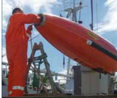
Vorbereitung der Messstation für den Meeresboden

EvoLogics GmbH ein Ultraschallmodem entwickelt, das wie die Delfine Informationen auf ständig wechselnden Frequenzen sendet und so in der Lage ist, Daten im Meer über eine weite Distanz hinweg störungsfrei zu übertragen. Die Experten nennen diese mit Ultraschall arbeitende Technik „Sweep Spread Carrier“ (S2C). Damit können Messdaten ebenso übertragen werden wie Steuerdaten oder auch Bilder. Mit dem S2C-Patent erforschen kabellose Kameras den Meeresboden und helfen, Rohstoffe aufzuspüren. Die S2C-Technik kann auch bei Tsunami-Frühwarnsystemen eingesetzt werden, da das Modem Daten aus bis zu 5000 Metern Wassertiefe an eine GPS-Boje an der Oberfläche senden kann. Von dort gehen sie zu Satelliten, die die Daten zum Datencenter schicken, wo sie ausgewertet werden.