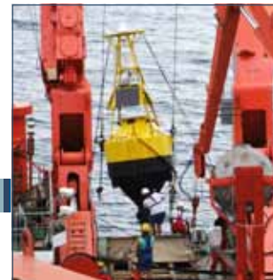
Eine Boje mit dem Modem wird eingebracht