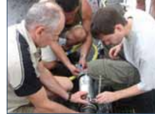
(3) Das S2C Modem wird auf hoher See vorbereitet